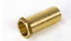
Verlenging externe ontgrendeling voor garagedeuren groter dan 15 mm. dikte