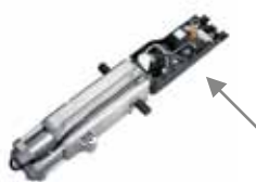
Sturing E550 (om in te bouwen in 550 ITT)