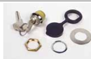
Ontgrendelingslot met gepersonaliseerde sleutel van nr. 1 tot 50

Artikelcode 424550001 tot 424550050 Prijs (€)