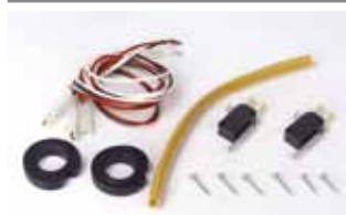
Kit eindschakelaars open en dicht (ingebouwd bij aandrijving 550 ITT) Artikelcode 390567 Prijs (€)