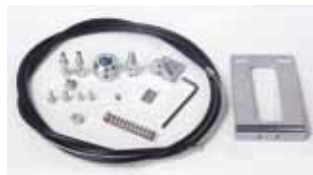
Kabelset voor externe ontgrendeling op handgreep