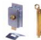
Diverse toebehoren pagina 179