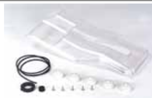
Bouwpakket voor beschermingsgraad IP44 Artikelcode 110554 Prijs (€)